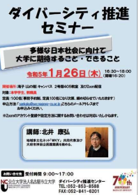
セミナーのチラシ