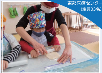
東部医療センター (定員33名)

今年はうどん作りに挑戦しました。調理師が小麦粉からうどんに変わる様子を実演し、衛生面に配慮して、子どもたちは「こねる」「踏む」「切る」といった作業を体験しました。自分で作ったうどんは特別に美味しかったようで、いつも以上に「おかわり」とたくさん食べていました。