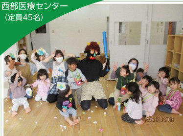
西部医療センター (定員45名)