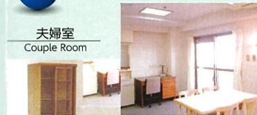
夫婦室 Couple Room