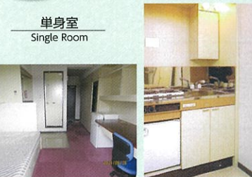
単身室 Single Room