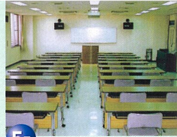
研修室 Lecture Room