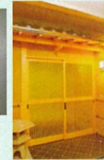
和室 Japanese Room