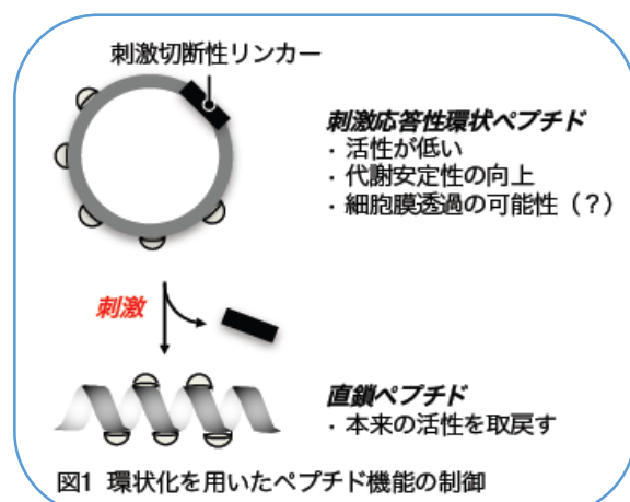
図1 環状化を用いたペプチド機能の制御

産学官共創イノベーションセンター (桜山キャンパス本部棟2階/事務局学術課内) 〒467-8601 名古屋市瑞穂区瑞穂町字川澄1番地 (名古屋市営地下鉄桜通線「桜山」駅③出口すぐ) ☎ 052-853-8309 FAX 052-841-0261 ✉ ncu-innovation@sec.nagoya-cu.ac.jp