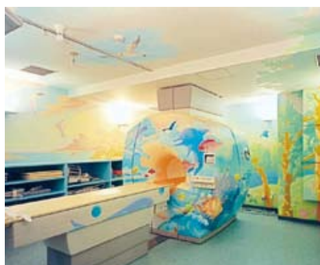
あいち小児保健医療総合センター MRI室での装飾