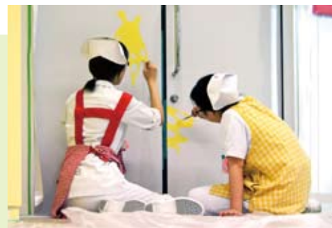
名古屋第二赤十字病院小児外来での作業風景

医療または福祉の現場を訪問し、実際にアートを導入する実践型プログラムを開催します。現場視察から企画構想、具現化、現場での制作までの一連のヘルスケア・アートの取り組みを体験し、講師や参加者とともに具体的な学びを得ることができます。詳細は7~8月頃になごやヘルスケア・アートマネジメント推進プロジェクトHP等で告知します。