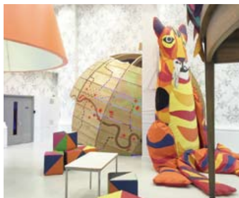
The Ann Riches Healing Space - Activity Space The Royal London Hospital 2013