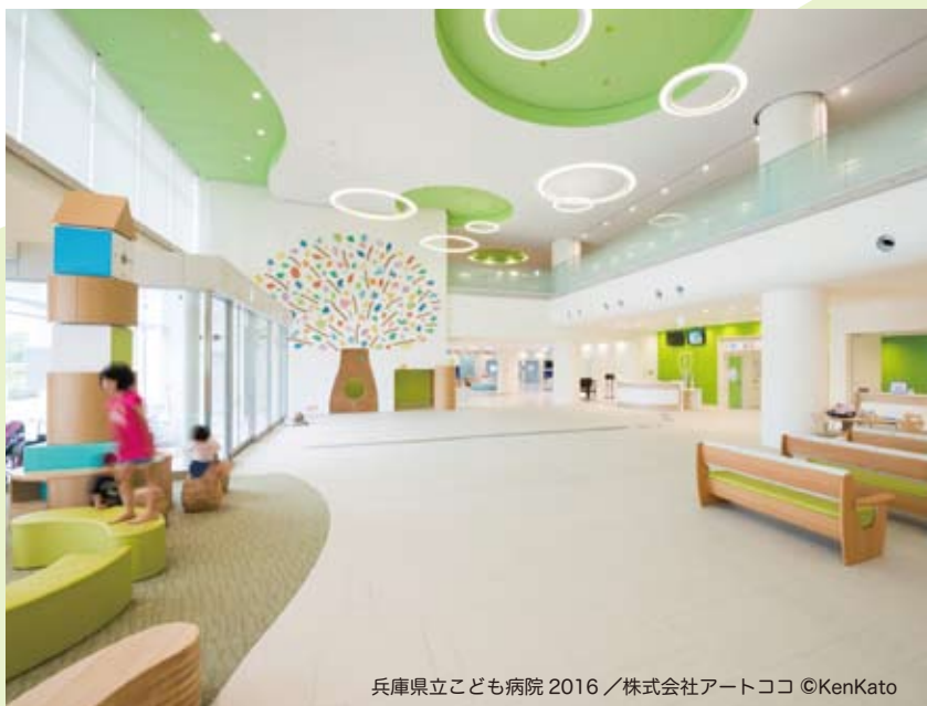
兵庫県立こども病院 2016 / 株式会社アートココ ©KenKato