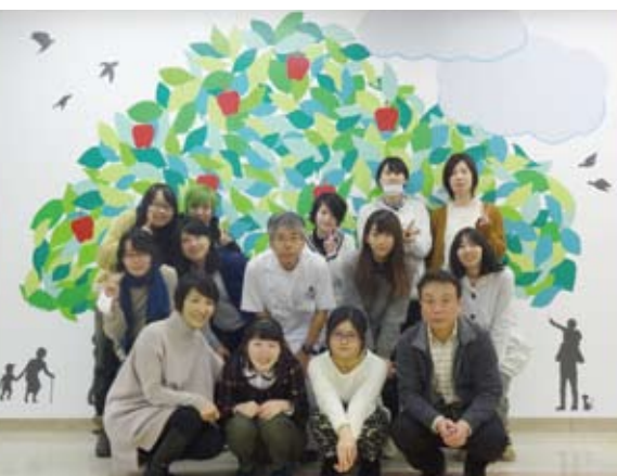
近畿大学医学部附属病院での活動