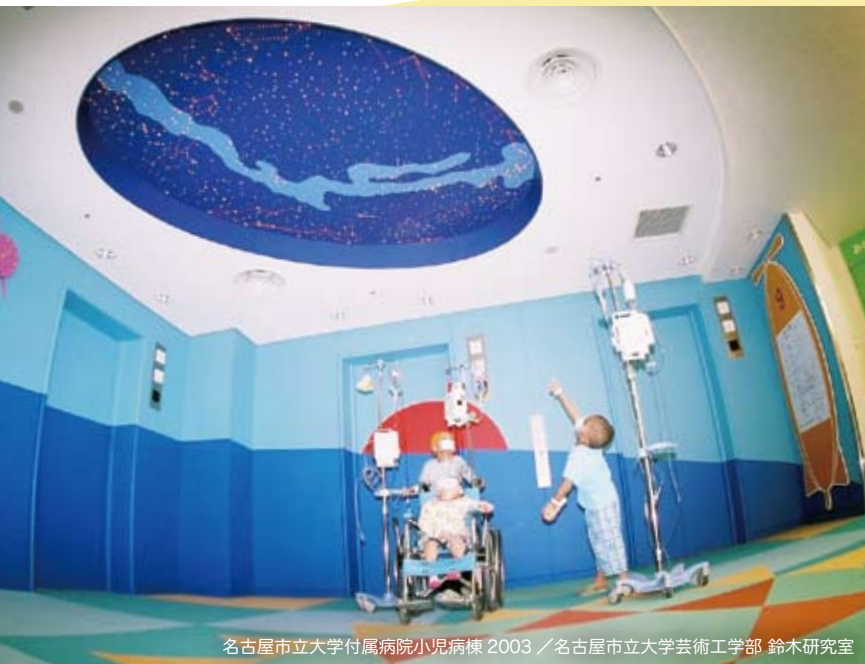
名古屋市立大学付属病院小児病棟 2003 / 名古屋市立大学芸術工学部 鈴木研究室