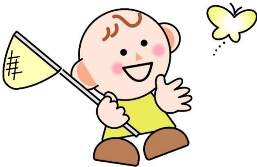
なごや子どもの権利条例 マスコットキャラクター なごっち