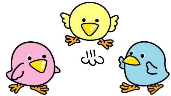
なごや未来っ子応援制度 マスコットキャラクター ぴよか